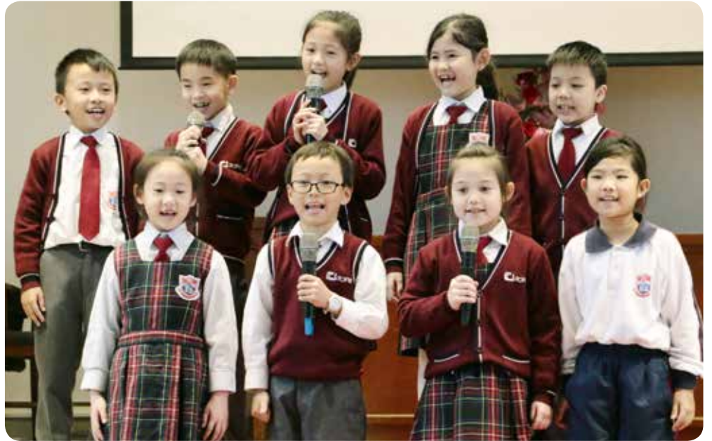
小二同學參加英文歌唱比賽展現潛能。