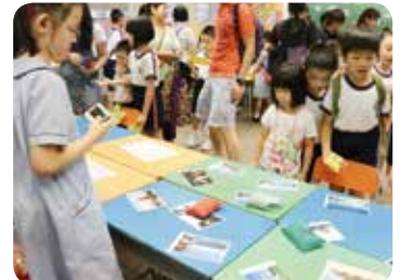
同學們透過玩遊戲認識不同地方名稱。