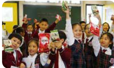
美食配英語，讓同學們邊吃邊學。