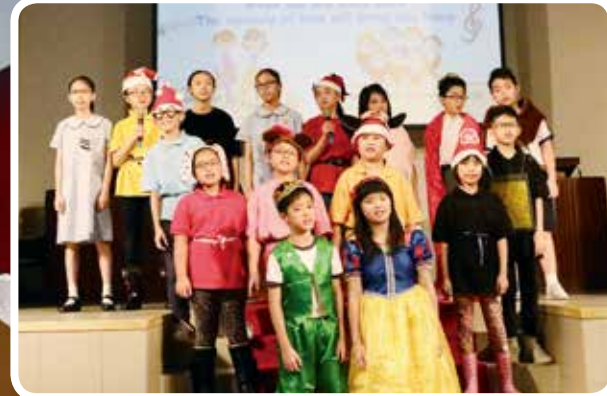
《快樂王子》(右圖)與《白雪公主》(左圖)分別是過去兩年的英語話劇演出劇目。

除了活用英語，學校冀透過話劇培養學生的正確價值觀，如《快樂王子》當中就讓小朋友明白到不少大道理。