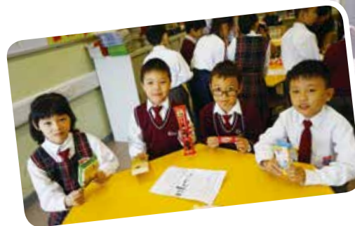
老師將英語室變了超級市場，全為製造實景教學。