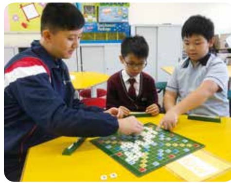
同學在小息時玩 Scrabble，有助認識更多英文生字。