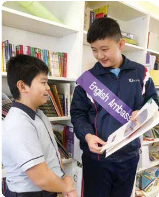
學校特設英語大使計劃，同學們亦積極參與、努力實踐職責。