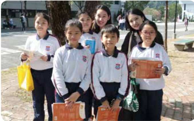
兩位友善的中大姐姐接受了同學們的訪問。