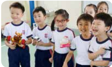
以玩具輔助學習英語，讓學生感覺更愉快。