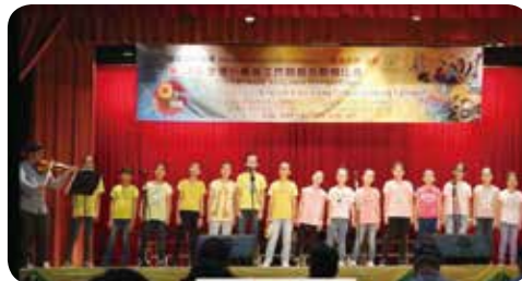
英語民歌是學習的重要媒介之一。