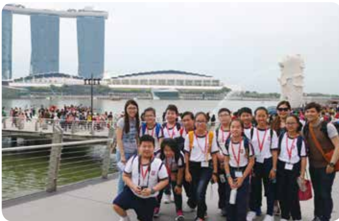
同學們在新加坡交流，除了學習，也享受觀光的樂趣。

在校內方面，學生同樣不缺跟外籍人士交流的機會，因為這裡所有學生，每周均有不少於25%的課時由外籍老師進行英語教學。在初小階段以教授拼音及基本閱讀策略為主，加強學生的發音能力、拼字技巧及閱讀能力，為未來學習打好基礎。高小則滲入高階思維技巧及創造力元素，進一步提升學生的英語能力。憑著外籍老師創新有趣的教學方式，讓學生作體驗式學習，加上不定期的說話訓練，使學生在發音及說話流暢度方面，有顯著的提升，使之更有信心於生活中活用英語。