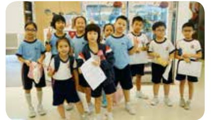
逛街學英語，當然沒有難度。