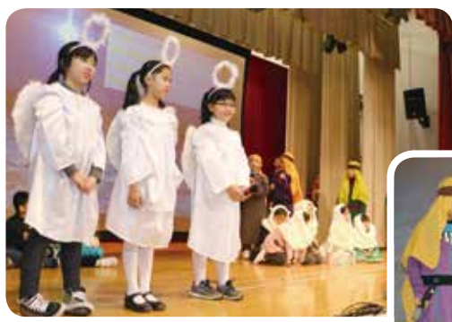
低年級學生透過英語戲劇活動培養語文興趣。