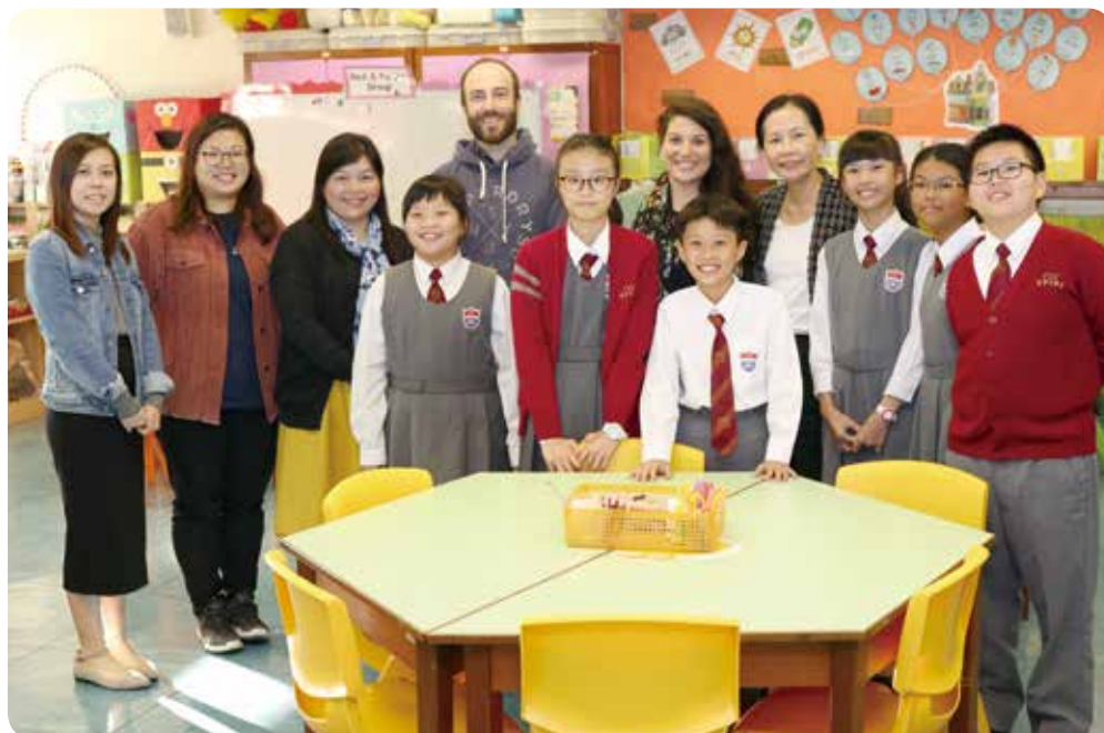
中華基督教會何福堂小學師生 共同營造愉快英語學習環境。