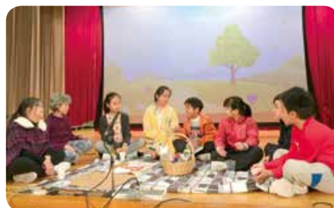
高年級英語戲劇，讓學生可以活用英語，提升自信。