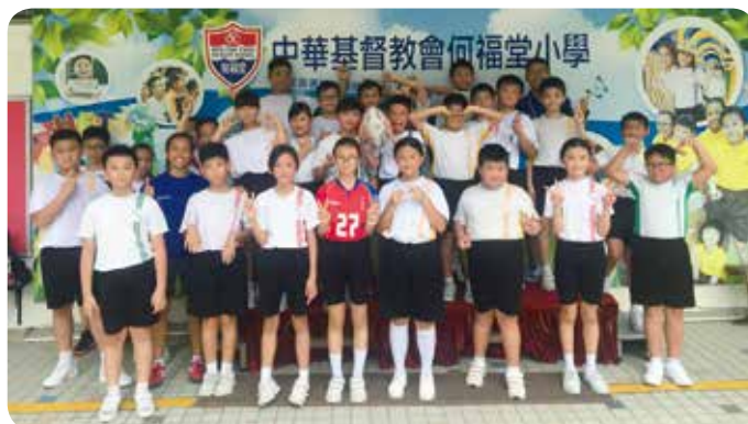
學校參加 Rugby English Action Learning 計劃，以欖球運動作為教授英語的媒介，讓學生認識更多英文詞彙，增強他們應用英語的信心。