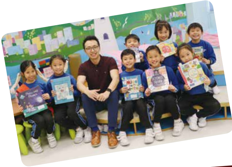
經過老師推介的英文圖書，同學都爭相借閱，借閱率大幅飆升。