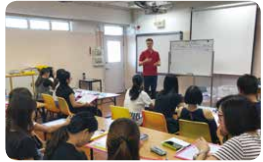
學校每年舉行家長英文工作坊，教授家長拼音及閱讀技巧，促進家校合作。