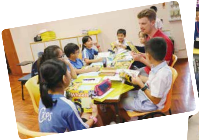
(左) 高年級學生正進行引導閱讀計劃。 (右) 低年級學生每周獲發家庭閱讀獎勵計劃教材套，在家中培養閱讀習慣。