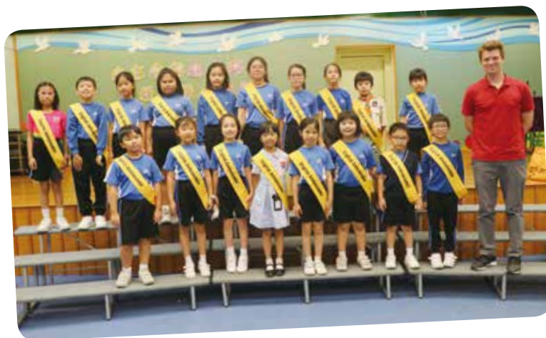
外籍老師培訓學生擔任英語大使，在不同活動中推廣英語。