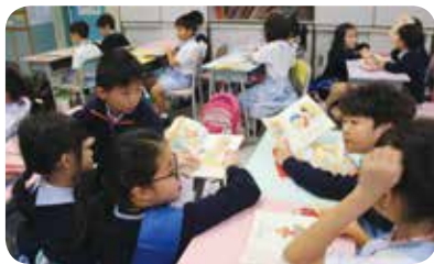
高年級同學化身為「英文伴讀大使」，與低年級同學一起閱讀英文圖書。

「書到用時方恨少」，正好用來應用學習語文的情況，閱讀和寫作需要從小培養，才能打好語文根基。中華基督教會元朗真光小學使用校本英文字詞庫，豐富學生詞彙，及配合閱讀和寫作策略，學生可以在輕鬆愉快的學習環境下，培養閱讀和寫作的習慣，從而提升語文學習的效能。