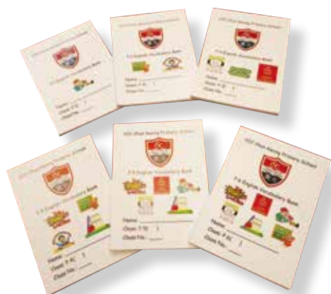
學校為學生貼心提供校本英文字詞庫，豐富學生的英語詞彙，提高英語表達能力。

學生掌握相關閱讀技巧後，便將該單元所學的句式運用到寫作上。談到寫作，自然離不開字詞，為了豐富學生的字彙，學校設計了一系列的字詞庫。周主任說：「學生除了學習課本的字詞外，校方亦設計校本字詞庫，根據不同主題及詞性，幫助學生建立豐富的詞彙。此外，學校亦鼓勵學生自行摘錄佳句，記錄在字詞庫，成為學生的寫作好幫手。」當學生寫作時，配合不同的思考工具，例如：腦圖、六頂思考帽、六何法等組織文章，以便利寫作。