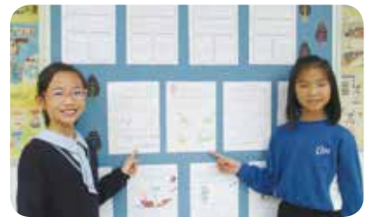
學生有機會在校園展示閱讀後感，向同學推介喜愛的圖書。