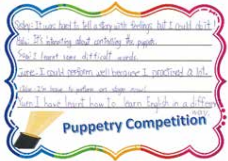
參與布偶劇比賽的學生表示，活動讓他們英語水平得以提升。