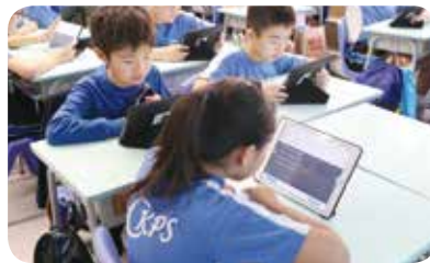
學校提供電子閱讀平台，培養學生閱讀的習慣。