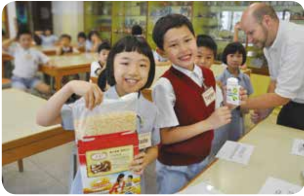
外籍老師將常識科與英文科活動結合，讓學生有趣地進行跨科學習。