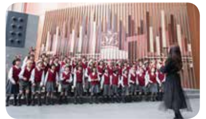
合唱團多次獲得校際音樂節外語歌曲組冠軍，經常獲邀作公開演出。