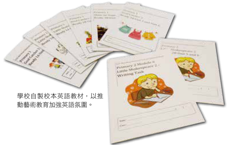
學校自製校本英語教材，以推動藝術教育加強英語氛圍。

該校校本課業設計中，引入自主學習、同儕學習、家長參與等元素，一方面提升英語課程的趣味，另一方面將英語學習與生活經驗緊扣，為學生更有效地運用所學，所以家校合作是不可或缺的一環。黃校長說：「在學習語言時，閱讀是關鍵元素，所以學校十分重視閱讀，如果家長在家中能夠幫助小朋友培養閱讀英語的習慣，效果便會相得益彰。為此，學校每年都會舉辦有關親子英語圖書閱讀的講座。」透過這安排，家長並非充當了老師的角色，而是透過閱讀加強親子關係，與小朋友同行之餘，也建立起小朋友閱讀的興趣。