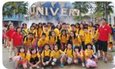
學生積極參與遊學團，活用英語，拓闊視野。