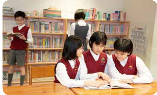
學校有良好的閱讀風氣，鼓勵學生早上、小息、午間也閱讀。