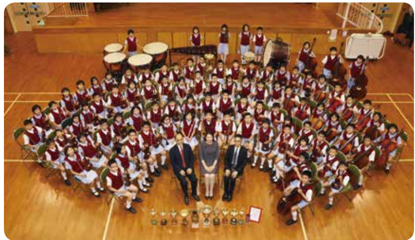
學校管弦樂團自88年起代表學校參加「香港校際音樂節」及「香港青年音樂匯演」等比賽，更曾獲全港中小學冠軍。