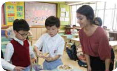
外籍英語老師設計有趣的課堂活動，讓學生能實踐書本中的內容。