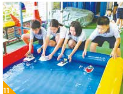
9. 「讓我閃耀計劃」包含不同類型戶外活動，當中更有活動跟常識科互相結合，過去學校曾就健康飲食的主題，帶學生去製作一個健康的薄餅。 10. 學校嘗試把藝術 (Art) 融入 STEM 當中進一步推動 STEAM，如學生學習閉合電路後，製作光影燈座。 11. 學校每個學期都有跨學科 STEM 專題研習，同學們製作太陽能船後，在科技日進行比併。

現父母在生日會上切出來的蛋糕大小不一，不公平之餘，不整齊的切邊亦破壞了蛋糕的賣相，感到相當掃興。學生們後來構思用上一個籃球架框、一條結他線和一個轉盤，造出「神奇切餅器」，從此分餅變得輕鬆起來，人人都能開心地享用蛋糕。